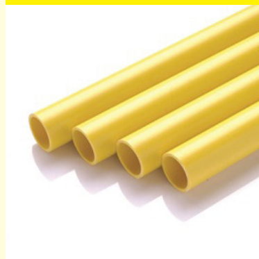
ชนิดปลายเรียบ (Plain End)